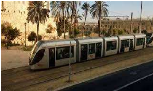
Imagen: Jerusalem Light Rail a la ciudad de Jerusalem

La empresa española de consultoría de transporte Ineco participa en el consorcio internacional para la construcción del "Jerusalén light train", el tranvía que conecta los grandes bloques de asentamientos ilegales del Este de Jerusalén con la parte occidental de la ciudad. Este sistema permite el rápido movimiento de colonos en Cisjordania, mientras que la ocupación provoca graves restricciones de la libertad de movimiento de los palestinos. Por tanto, el proyecto de transporte contribuye a la política de expansión de los asentamientos ilegales y a la expropiación de tierras palestinas para su construcción. La política de colonización de Israel basada en la expropiación, anexión y explotación de recursos naturales palestinos es un delito internacional, condenado por Naciones Unidas.