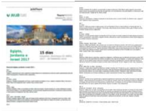
Imagen: Oferta turística del Tour a Oriente Medio 2017 de Julià Tours

La empresa Grupo Julià ofrece paquetes turísticos designando a Jerusalén como capital de Israel. En sus ofertas turísticas tampoco da ningún tipo de información de la situación de ocupación de los Territorios Ocupados Palestinos. Sus paquetes turísticos no incluyen estancias en los TOP, a pesar de que muchas de las actividades se realizan en áreas de Cisjordania.